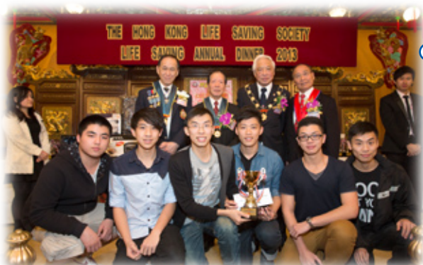
2012年泳池義務救生服務冠軍－衛星游泳會 (合共100分)