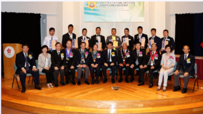
香港消防處得獎者合照