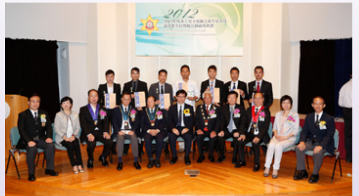
香港警務處得獎者合照