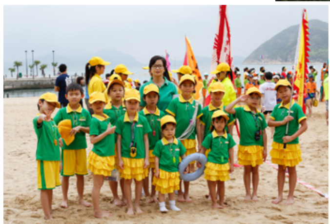
活潑可愛的小鐵人