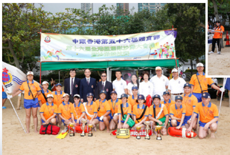
香港救生優勝盃（男子組及女子組）亞軍得主－醫療輔助隊