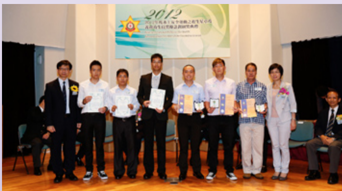
香港海事處得獎者合照