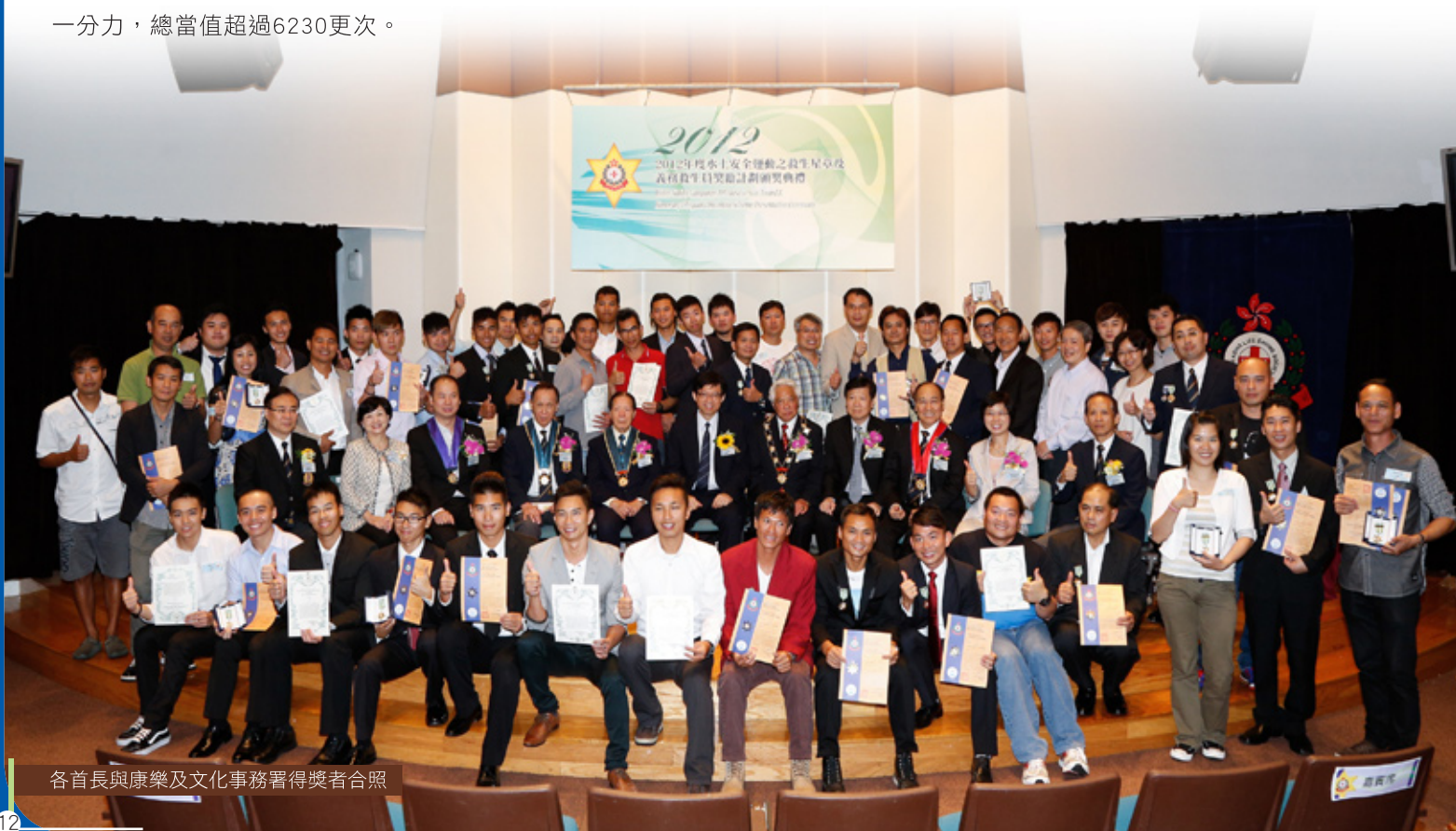
各首長與康樂及文化事務署得獎者合照

團體拯救優異盾乃是本會特別於本年增設的獎項，目的是表揚優異的團體拯救事件。本年度總會認為香港消防處在去年10月1日海難事件上，充分發揮了拯溺救生的精神，各救援人員都盡了自己的能力，在危急混亂的情況下拯救溺者，最終成功拯救了80多名人士。每一位參與的救援人員都是值得尊敬的救人英雄。