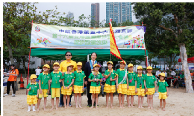
首次參加步操隊伍－藍海洋體育會