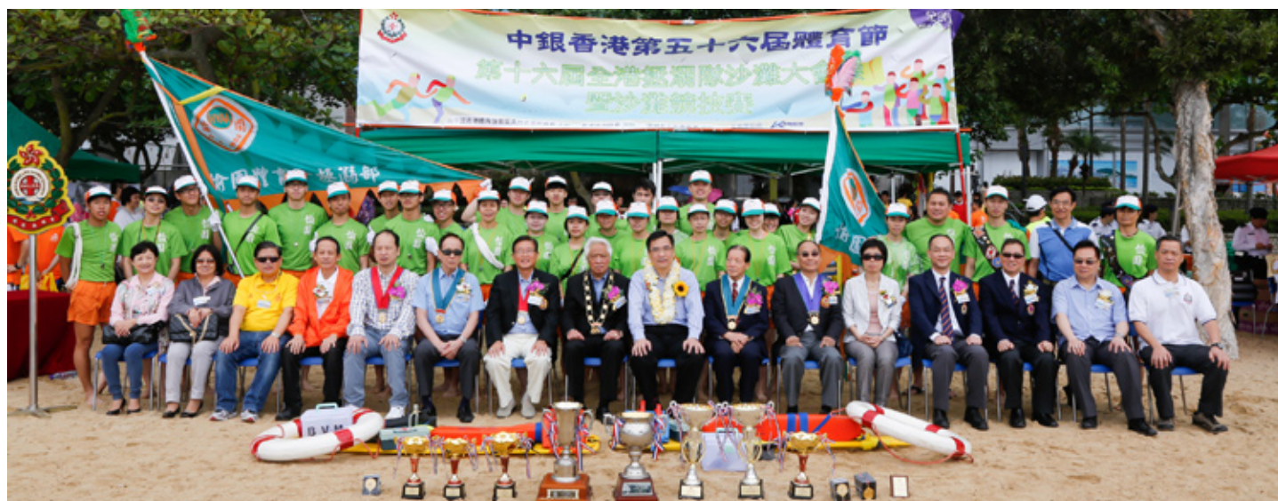
香港救生優勝盃（男子組及女子組）冠軍得主－愉園體育會有限公司