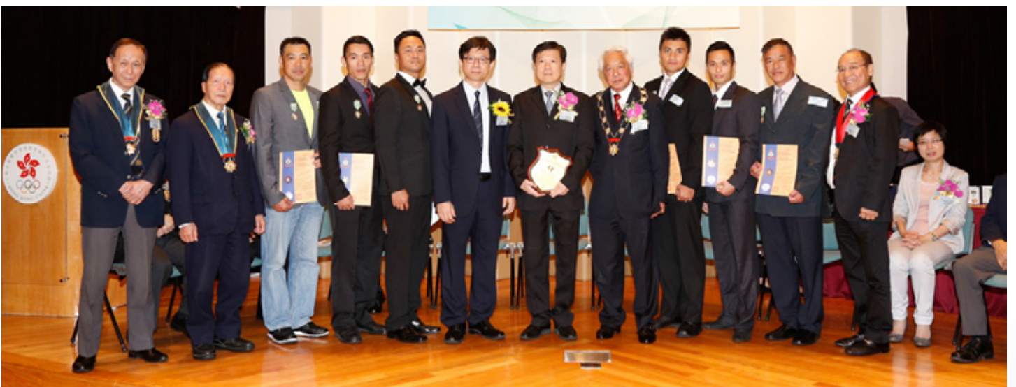
團體拯救優異盾由香港消防處獲得