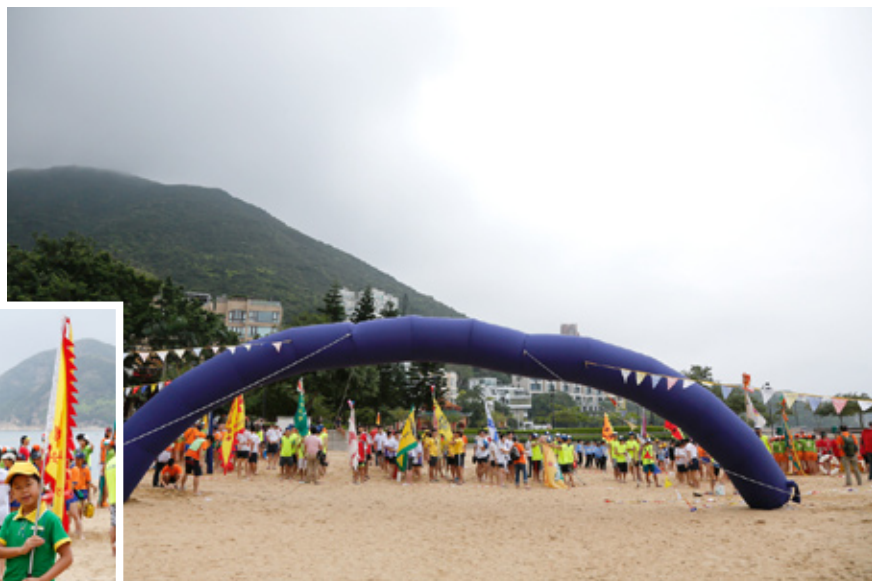
步操隊伍整裝待發