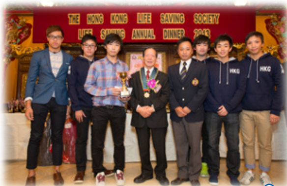
2012年泳灘義務救生服務冠軍－南區拯溺會 (合共85分)